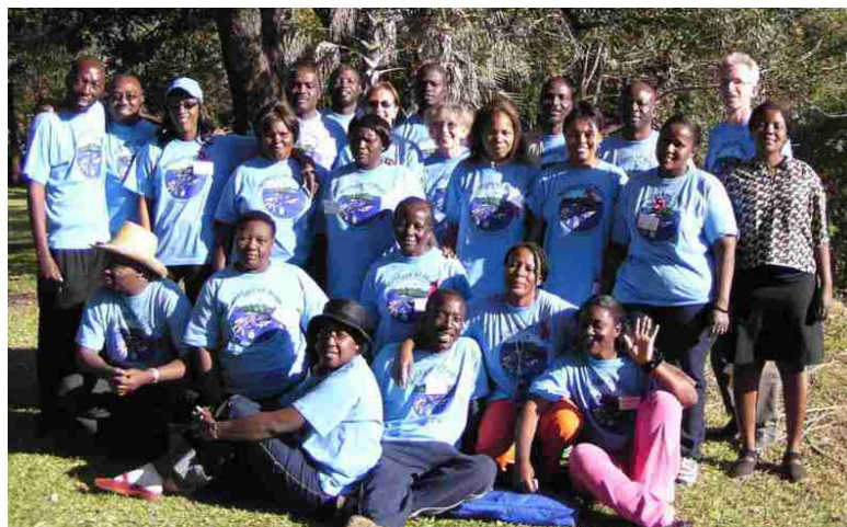
Fig 1: Participantes e facilitadores da Zâmbia, Zimbabwe e Namíbia, nas novas T-shirts da Bridges of Hope .

O programa de quatro dias permitiu que fossem realizadas duas 'sessões de formação prática sobre a vida real', uma fazendo actividades de extensão nas ruas e mercados de Livingstone, e a outra com grupos alvo pré-definidos, incluindo trabalhadores da empresa, um grupo da escola secundária e um grupo de apoio às pessoas com deficiência auditiva (Vide a Fig 2).